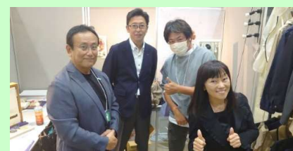
【共同出展者と記念撮影】

シンシア様と共同出展したC社の皆様との一枚。C社は女性向けの作業着、空調服をプロデュースされており、その目新しさから多くの人が興味を持たれていました。