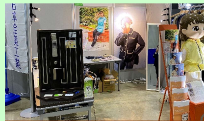
【出展ブースの様子】