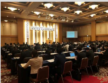
当日の会場の様子