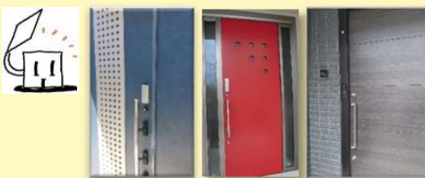
旭化成『ヘーベルハウス』の設置例

旭化成ホームズ様の ヘーベルハウス を中心に、弊社代理店・各業者様のご協力をいただきながら日本全国各地に順調に設置させていただいています。また、最近では弊社ホームページからの直接のお問合せも増えています。 最近の傾向としては玄関だけでなく自宅門扉への設置と遠隔解錠操作のお問合せが増えています 。その背景として①門扉への設置ニーズ自体が増えていること②他社には難しいオーダーメイドによる対応がセキュラには可能であることがその理由にあると考えています。