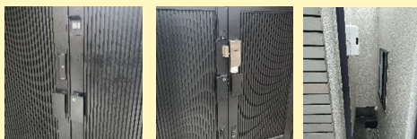
自宅門扉への設置写真。セキュリティ、利便性の対象ニーズが拡大しています。