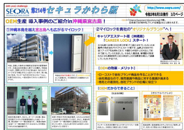
【2021年8月 かわら版 キャリアエステート様特集記事】 オリジナルブランド「キャリアアロック」として、沖縄本島～宮古島へもご提案・設置いただいています。