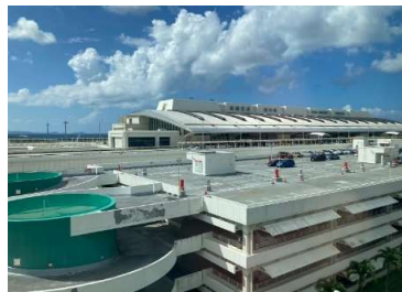
【那覇空港の様子】 当日は青空が広がり、まさに「沖縄日和」といった天気でした。

この度、沖縄県で開催された物件内覧会にセキュラも参加させていただきました。本内覧会の主催は、以前のかわら版でもご紹介させていただき、 現在OEMでキャリアアロック(マイロック)を導入・推進いただいているキャリアエステート様 です。ご来場いただいた方々へは、私たちも物件の内覧に合わせて積極的にお声掛けし、キャリアアロックの良さをアピールさせていただきました。