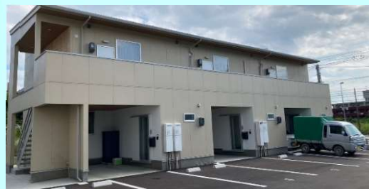
こちらの物件は1Fがガレージ兼玄関となっており、玄関扉は引戸タイプの仕様となっています。