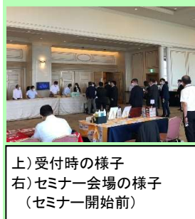
上)受付時の様子 右)セミナー会場の様子 (セミナー開始前)

九州支部の定例会が宮崎県で行われ、私たちが久しぶりに参加させていただきました。日管協・全管協主催の集会もコロナの影響を受け、中止、延期、リモート参加、感染拡大エリアか否か等を慎重に考慮して、開催の有無・方式を検討されています。セミナーでは、6月に全面施行された「賃貸住宅の管理業務等の適正化に関する法律」に基づく管理会社の登録制度、国家資格となった賃貸不動産経営管理士などの説明があり、私たちが現在の賃貸管理業界の流れについて学ぶ機会となりました。