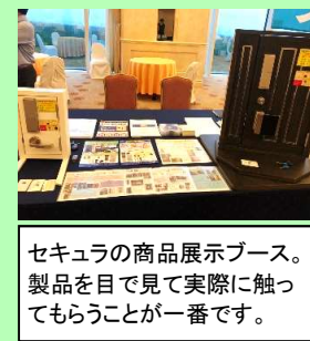
セキュラの商品展示ブース。製品を目で見て実際に触ってもらうことが一番です。