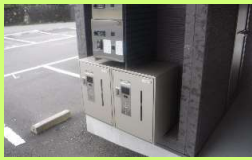
宅配ボックスの設置(下段)

「数ある賃貸物件の中から私の物件を選んでいただいた」そのことに対する深い感謝の気持ちが伝わってきました。その想いは清掃の行き届いた駐車場、共用部などにも表れています。先ずはお客様に感謝すること。私たちもその想いを大切にしたいと思います。