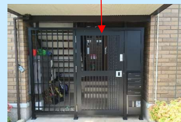
上)新たに増設された門扉

そこで開口部に①新たに門扉を設置。門扉は大和ハウスグループのデザインアーク社が担当しています。そして②セキュラのマイロックと遠隔解錠システムを導入してセキュリティ強化を図り物件力を高めました。