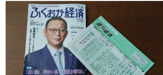
月刊誌(写真:左)と週刊誌(写真:右)それぞれに紹介していただきました。記事内容は、5月号でも取り上げた管理会社ハッピーハウス様との提携をはじめとした福岡市近郊の賃貸物件への導入提案の強化と今期の目標などが中心となっています。