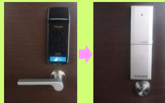
交換された海外製品(写真左)と新しく設置したマイロック(写真右)

A. 3年前の住宅フェアがきっかけでした。ただ、当時もマイロックのご提案をいただいたのですが、実はずっと悩んでいました。というのも、海外製の電子錠を設置したばかりだったのです。しかし、毎月送られてくる「かわら版」を読みながら品質面やアフター対応の面での思いが強くなり、今回導入を決めました。