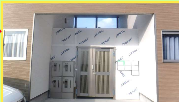
門扉、宅配ボックス、マイロックの設置後の写真