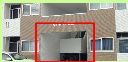
門扉が設置される前の状態

7月のかかわら版でマイロックと宅配ボックスの設置事例、そしてオーナー様インタビューにご協力いただいた鹿児島県Sオーナー様の2棟目の設置事例をご紹介します。今回は各戸にマイロックを設置、さらにエントランスに門扉を設置した後にエントランス用のマイロック、宅配ボックス、遠隔解錠システムを設置・導入した事例です。