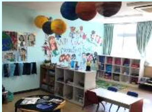
こどもたちの学び場です。元気いっぱいに学んでいます。