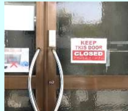
"KEEP THIS DOOR CLOSED" 案内表記も英語です。