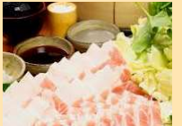
アゲー豚: 沖縄のブランド豚です。

古くは中国から伝わり、飼育の発展を経て豚肉料理が定着しました。沖縄では豚は「鳴き声以外全て食べる」と言われ、いろいろな部位の料理が楽しめます。