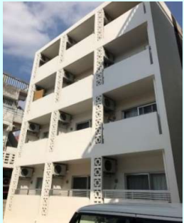
普通の賃貸マンションに見えますが民泊施設です。

沖縄ではインバウンド需要の高まりを受けホテルや民泊施設の建設が増えています。今回は民泊向け集合マンションにマイロックを設置させていただきました。エントランスにはVリーダーを、各部屋にはマイロックを設置し、利用者は受け取ったICカードを利用して入館・入室を行います。カードが無いと入館できないので、無関係な人の出入りを防ぐことができ宿泊者は安心して利用できます。マイロックは宿泊施設やウィークリー・マンスリーマンションなど短期間の利用が想定される施設においても効果的な役割を果たします。