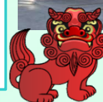
キャリアエステート社のマイロック導入物件(一部)