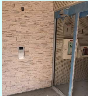
エントランスにはVリーダーを設置。カードで入館します。