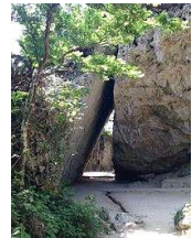
斎場御嶽 (せーふあうたき)

沖縄には古くから独自の信仰が伝わっています。御嶽は琉球の信仰の祭祀をおこなう場所で、現在でも多くの場所に存在します。