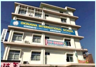
那覇市ではじめて設立されたインターナショナルスクールです。

英語環境での幼児保育を目的として設立された施設です。保育・幼稚部の他に小学・中学部も設置されています。入園者は日本人のお子様が多く、中には県外からも沖縄での教育を希望され移住されてくる方もいらっしゃるようです。小さなお子様のいる施設ですので、外部からの侵入の防止、また誤って子供たちが外に出してしまうことも防ぐことができ、より安心な環境整備にお役立ちさせていただきました。