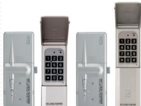
ECロックを基にマイロックが開発されました。