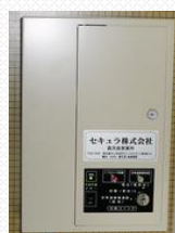
ECロックテンキー(左)、制御装置(右)