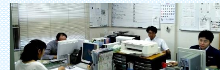
情報共有の為にミーティングを行います。普段の日々の報告も積極的に行っています。