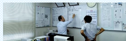
スケジュールを綿密に確認します。急な依頼が発生する場合もあるため定期的に行います。

迅速に対応すると同時に、工事メンテナンスを行う上で発生する音、作業時間帯のお客様の有無、行員・職員専用の通用口か否かなど、現場によって求められる対応は異なります。また、どうしても延期が難しい日程であったり、外部での作業の場合は天候にも左右されることもあるため、どのような状況にも対応できるようしっかりとスケジュール管理を行います。