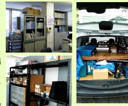
左:事務所内の様子。右:工事車両も整理整頓をします。

常にきれいな現場環境を整えるためには、普段使用する事務所や車輛を常にきれいに整理整頓の習慣付けを実践しています。