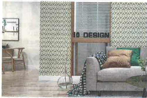
▲壁紙を変えるだけで印象が変わる

インテリアブランドの『プラフィーノ』を展開するテンフィールズファクトリー(京都府相楽郡)は、北欧風の模様や刺繍素材など100種類以上のデザイン壁紙を取り揃えている。アクセントクロスとしても活用されている。価格は平米あたり600~900円(税別)。