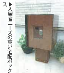
▲入居者ニーズの高い宅配ボックス

「面製品の需要の高まりを受けて開発した」(セキユラ・藤井英定専務取締役)。宅配ボックスのサイズはレギュラーとスリムの2種類。初期費用0円、月額リース料金6960円(税別)で、『マイロック』4台と宅配ボックス1台を導入できる。『マイロック』シリーズは1996年の販売開始からこれまでに約23万台の販売実績がある。