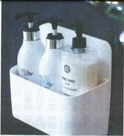
▲ポンプを収納したままポンピング可能

を製造するクイ・マック(大阪市)が販売する、マグネットで浴室内の壁面に貼り付けることのできるボトルラック『MAGPITA(マグピタ)』。カバーを取り外すことで掃除も容易になるように設計されている。