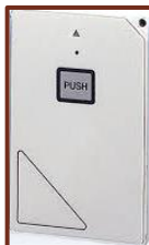
上: 遠隔システムボックス 左: 無線解錠用リモコン