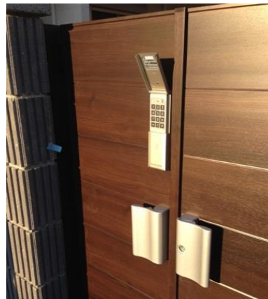
左: エントランス外側テンキー部 左下: エントランス内側本体部 ※防水対策の為ステンレスボックスを設置しています。

1. エントランスにマイロックを設置し、入居者様は暗証番号もしくはICカードで解錠できます。暗証番号を知らない、あるいは専用ICカードを持っていない人は入れません。