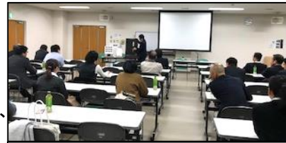
身乗り出しながら聞き入る参加者の姿。

私たちはマイロックを通じて、「安心・安全・便利な住環境の提供」に寄与したいと考えます。