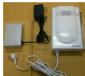
従来型リピーター