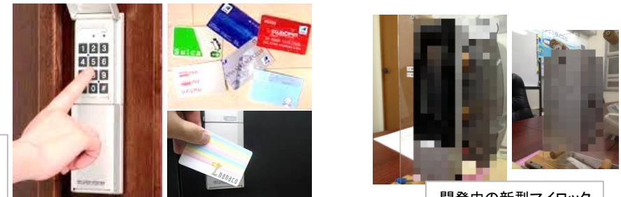
開発中の新型マイロック

セキュラでは2008年に初めてフェリカカードによる解錠システムを取り入れ(マイロックSF)、翌2009年には現行機種であるマイロックVFを発表し、現在に至ります。当初はこれほどまでにフェリカが普及すると確信していた訳ではありませんでしたが、ユーザー様の利便性を考え、より良い商品を開発するのにフェリカシステムは間違いなく有効な手段であると信じていました。その結果が今につながっていると感じています。現在、新型マイロックの開発も進んでいます。新しい機能に加えて従来のフェリカによる解錠機能も当然備えています。お客様の利便性を追求すると同時に常に安心・安全・便利を提供できるよう、セキュラは進んでいきます。